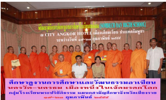
ศึกษาดูงานการศึกษาและวัฒนธรรมอาเซียน นครวัด-นครธม เมืองหนึ่งในเจ็ดมรดกโลก กลุ่มโรงเรียนพระปริยัติธรรม แผนกสามัญศึกษาจังหวัดเชียงราย ๑๙-๒๓ กุมภาพันธ์ ๒๕๕๕