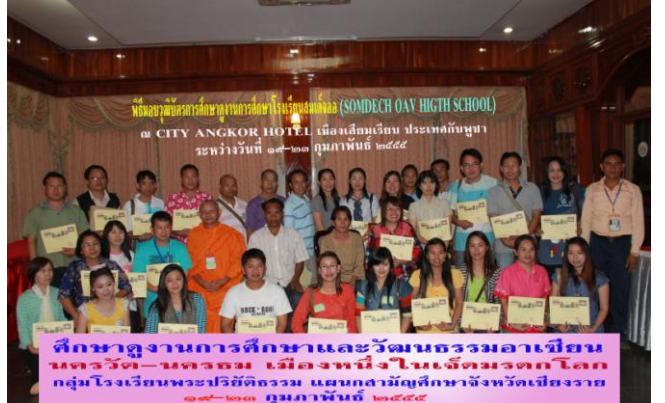
ศึกษาดูงานการศึกษาและวัฒนธรรมอาเซียน นครวัด-นครธม เมืองหนึ่งในเจ็ดมรดกโลก กลุ่มโรงเรียนพระปริยัติธรรม แผนกสามัญศึกษาจังหวัดเชียงราย ๑๙-๒๓ กุมภาพันธ์ ๒๕๕๕