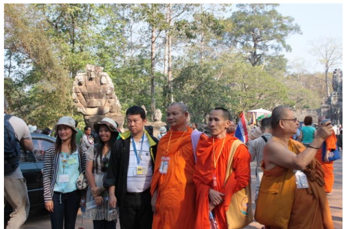
ศึกษาดูงานศิลปะมรดกโลกนครธม เมืองเสียมเรียบ