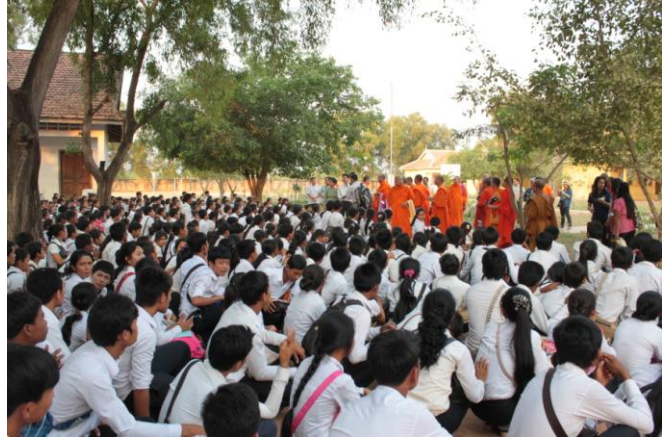
ศึกษาดูงาน ณ วิทยาลัยสมเด็จจ้อ เมืองเสียมเรียบ