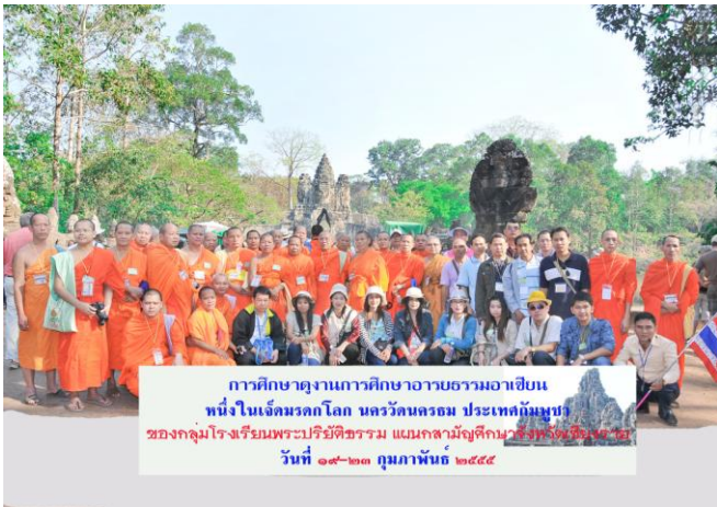
การศึกษาดูงานการศึกษาอารยธรรมอาเซียน หนึ่งในเจ็ดมรดกโลก นครวัดนครธม ประเทศกัมพูชา ของกลุ่มโรงเรียนพระปริยัติธรรม แผนกสามัญศึกษาจังหวัดเชียงราย วันที่ ๑๙-๒๓ กุมภาพันธ์ ๒๕๕๕